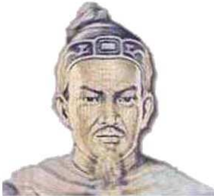
Chân dung Trần Quốc Tuấn Hưng Đạo Đại Vương