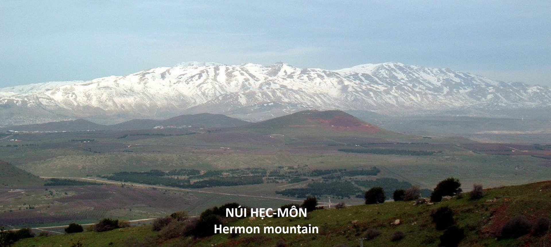
NÚI HỆC-MÔN Hermon mountain