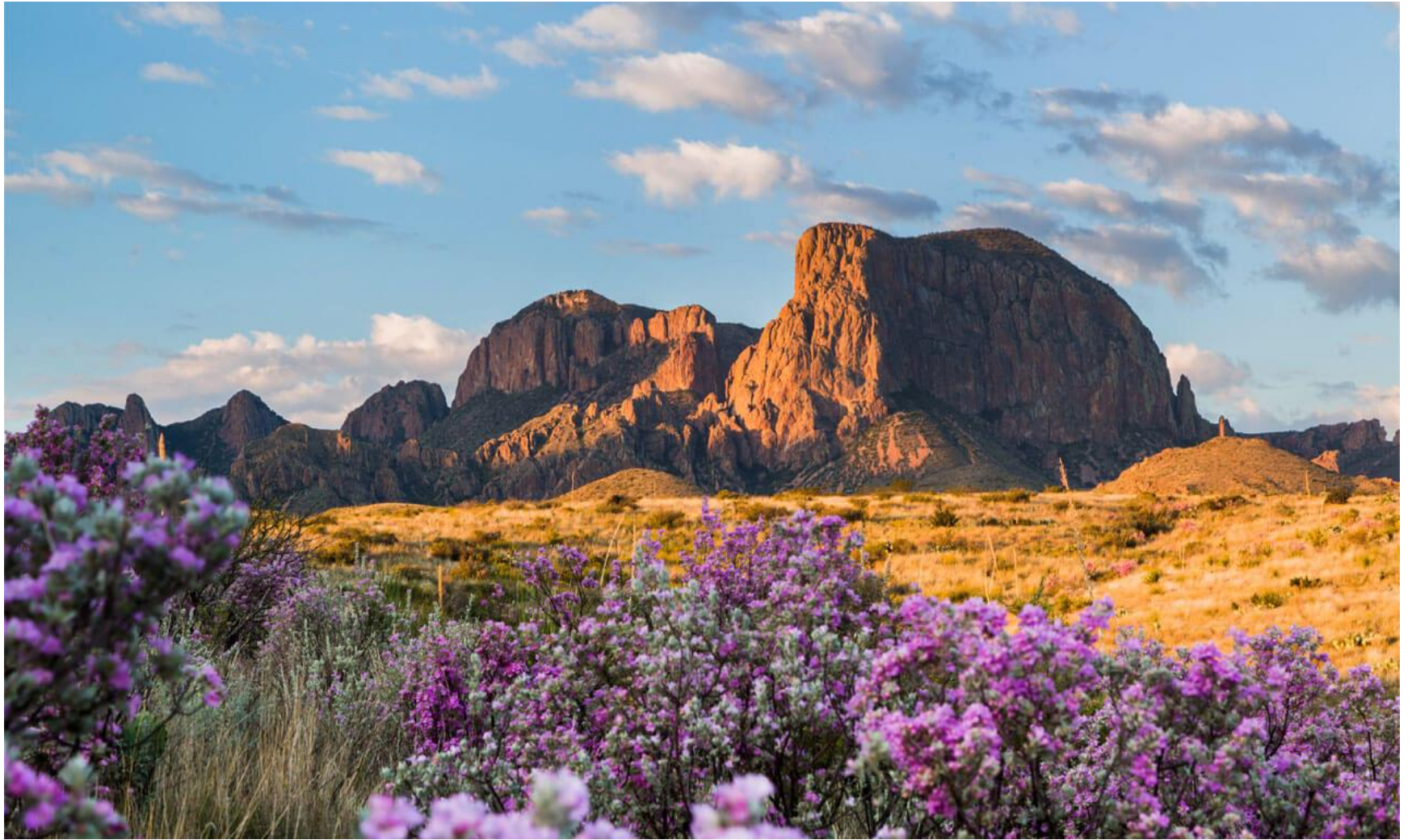
Hiking trail (Afternoon) : Big Bend Country, Texas