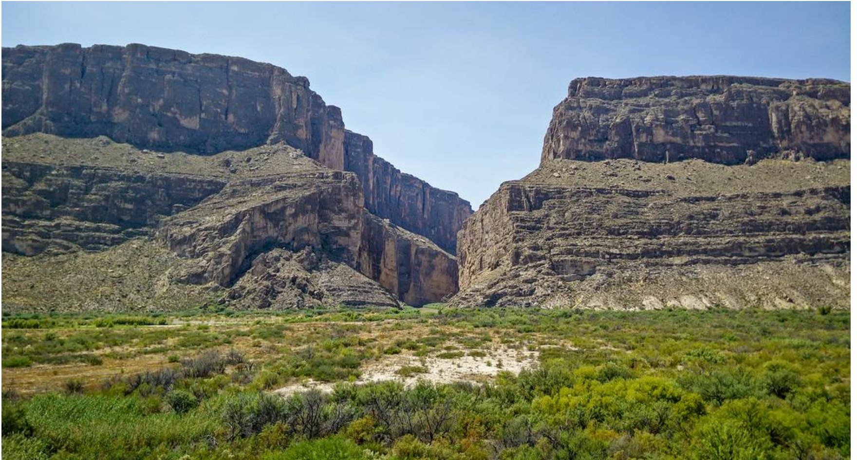
Driving Thru Big Bend Country, Texas