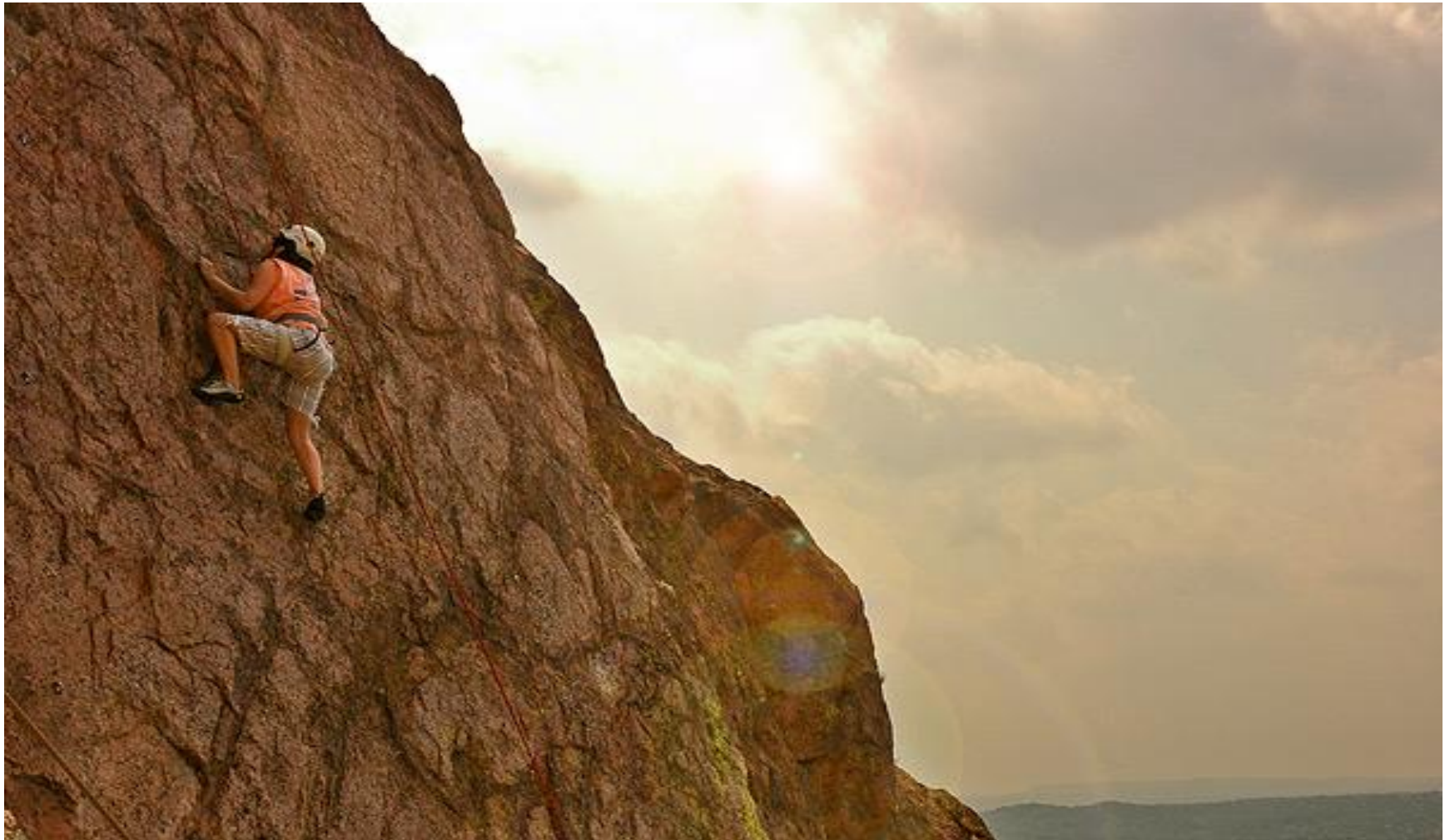
Enchanted Mountain, Texas