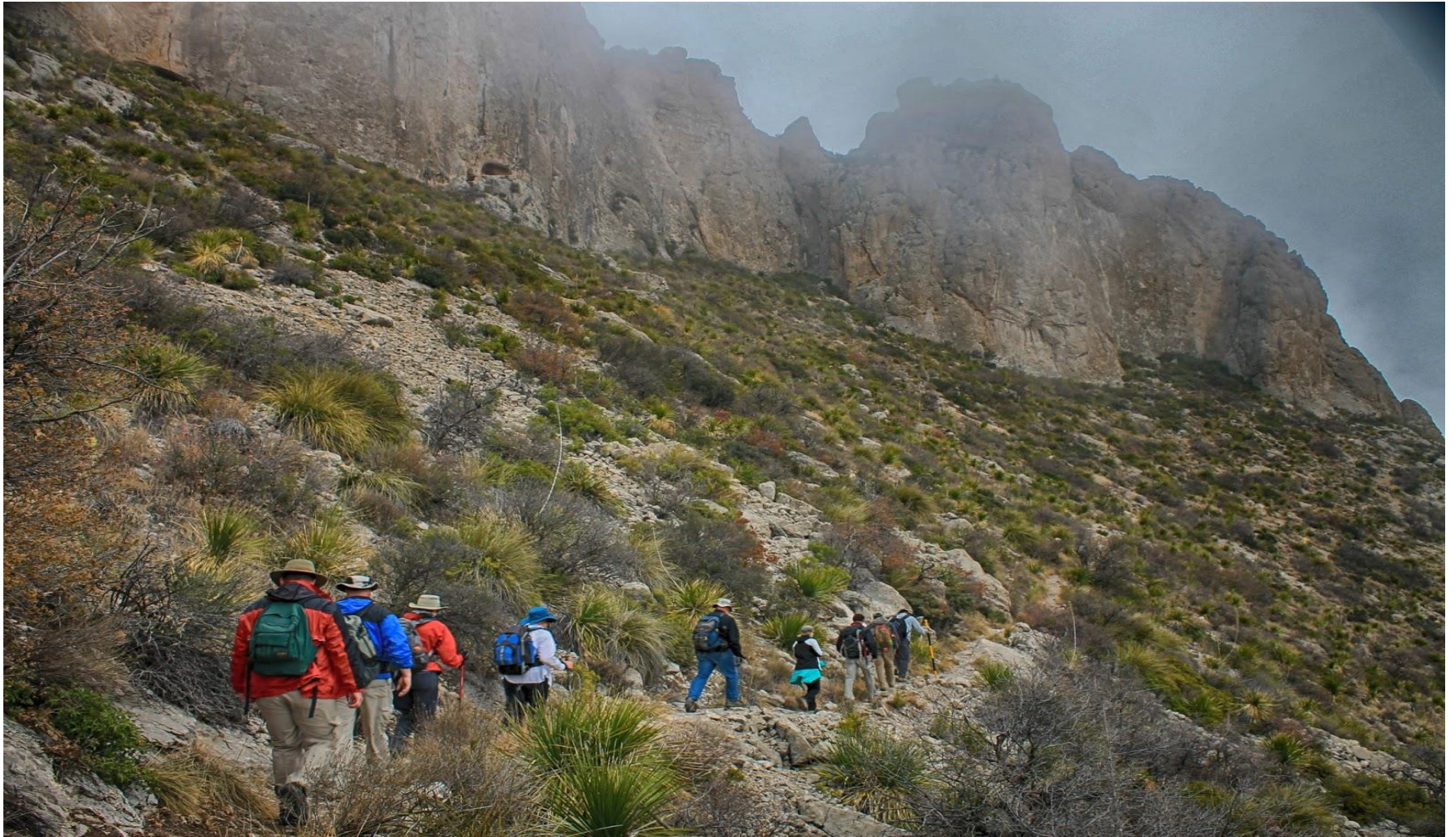
Hiking trail : Guadalupe Mountain, Texas