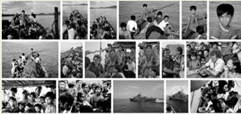
PHOTOGRAPHS BY VINCENT LONIC 1979