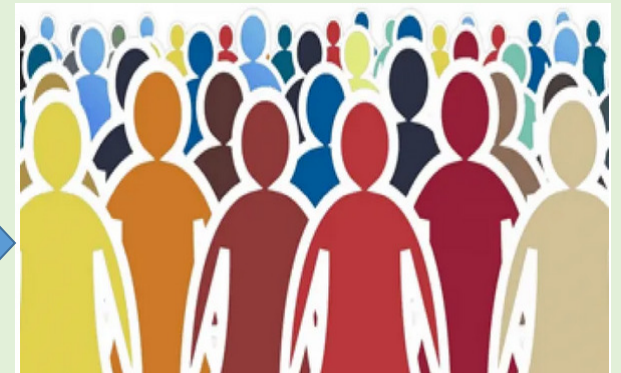
CỘNG ĐỒNG COMMUNITY