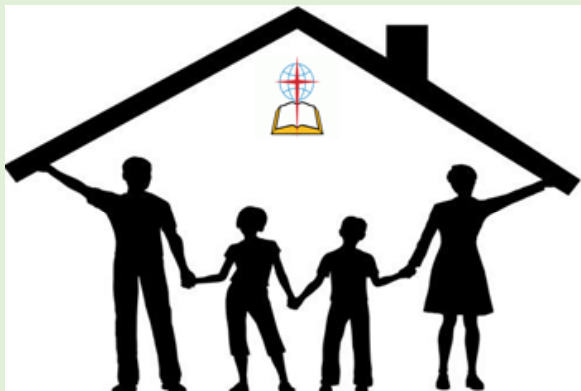
GIA ĐÌNH FAMILY