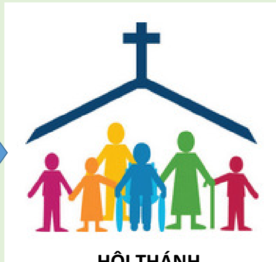
HỘI THÁNH CHURCH