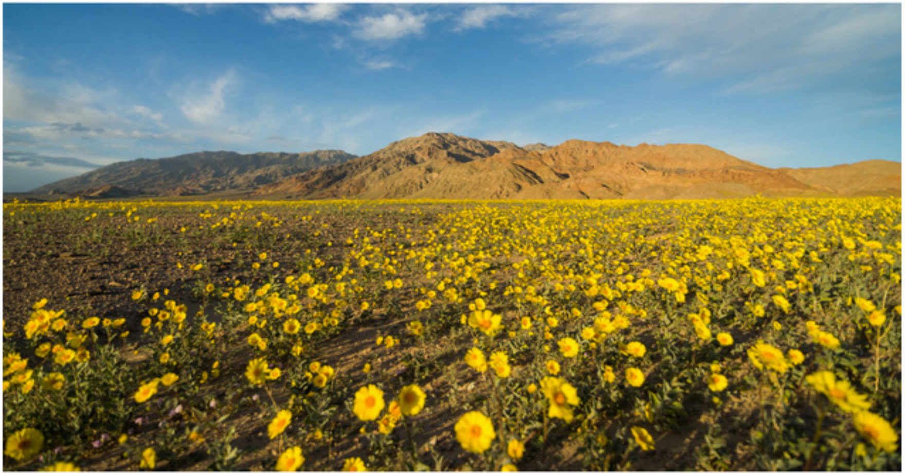
Desert Gold wildflowers carpet Death Valley during the 2016 "super bloom."